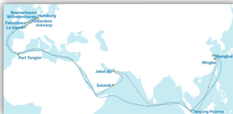
Рис.3. Основные направления работы мега - судов

3. Основные направления работы судов нового поколения. В основе формирования маршрута мага-судов лежат глубокие изменения в мировой экономике и структуре потребления в целом. Необходимо отметить тот факт, что промышленность Европы прогрессирует быстрыми темпами и уже сегодня ЕС испытывает дефицит ресурсов. Сегодня бурными темпами растет экономика Азии. Большое количество производственных центров находятся в Китае, Сингапуре, Южной Корее, Индонезии, Малайзии, Вьетнаме – чем и обуславливается актуальность работы судов-гигантов на направлении Азия – Европа (рис.3.), включая крупнейшие порты мира: Шанхай, Сингапур, Нингбо, Гонк Конг, Пусан, Антверп, Гамбург, Роттердам и др.