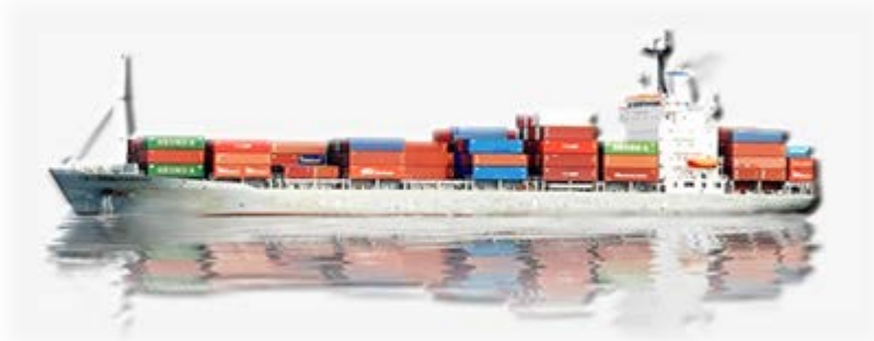
Рис.1. Доля собственного и зафрахтованного флота ведущих контейнерных операторов