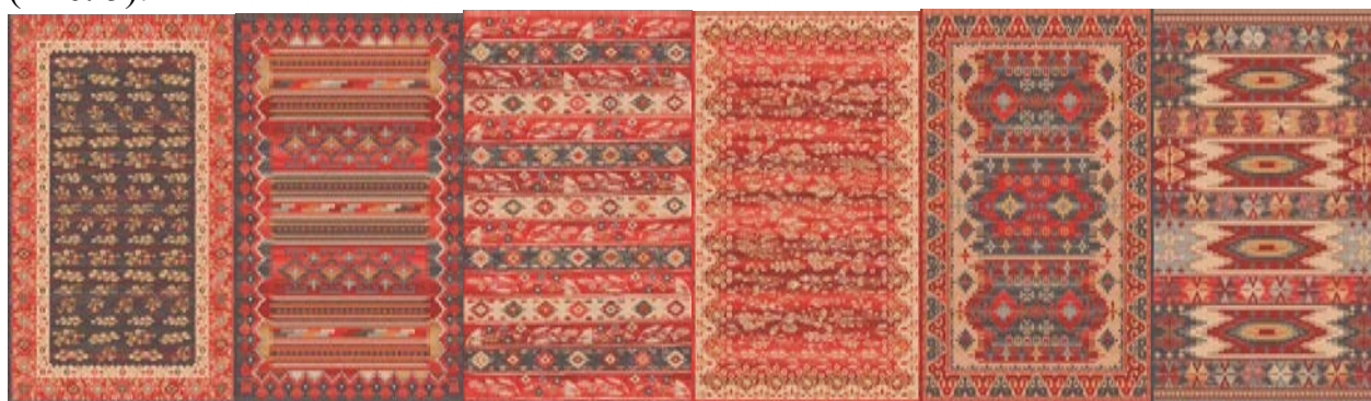
Camelia №585(6.3236). Ciry №611(6.3236). Florina №584(6.3632). Sanziana №589(6.3632). Cozmin №588(6.3632). Basarab №586(6.3236).

К аутентичной коллекции Этно (Ethno) относятся 1. Florina №584 ; 2. Camelia №585 ; 3. Basarab №586 ; 4. Cozmin №588 ; 5. Sanziana №589 ; 6. Ciry №611 . Для нее специально были разработаны и обогащены традиционные колориты , близкие к народным традициям , с оттенками насыщенного красного и других натуральных цветов – 3236, 3632, 62336, 63632, 63236, 60364 и 60360 (Рис. 5).