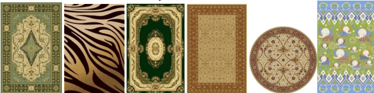
Gherati №566 (63417). Tanzania №529 (61149). Bushe №210 (5270). Magic №287(1149). Bagdad №065 (1126). Kids №654 (376).

в темном – контрастным акцентом (ковер Nuance 301, Aquamarin 189 ). В рисунках: Safari 13, Savanna 216, Cashtan 196, Damasc 443, Tanzania 529, Capella 457, Décor 494, Shimmer 291, Lavanda 234 , художники искали компромиссное сочетание классических приемов с инновационным подходом к дизайну (Рис. 1-3). Одновременно сохранив растительные элементы, свойственные узорам Европы и Востока, с примесью зооморфных орнаментов и геометризованных объектов [2; 4]. В колорите 3658 специалисты использовали контрастные цвета, где яркий бордовый оттенен золотым и коричневым. Подобная расцветка применяется в классических европейских и восточных покрытиях, а ее главная особенность – долговечность ( Sensi 256, Jadi 338, Nain 305, Mashad 139 и др.) [4].