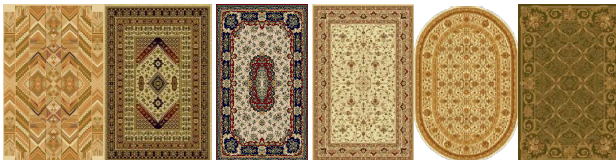
Oda №181 (200). Darius №436 (61126). Rose №113 (61126). Edem №249 (1126). Arabes №306 (1149). Fragrance №477 (5542).

классики или прованса, а популярные ныне африканские орнаменты, особенности чужеземной флоры и фауны дальних континентов свободно уживаются с современными веяниями дизайнерской мысли [4].