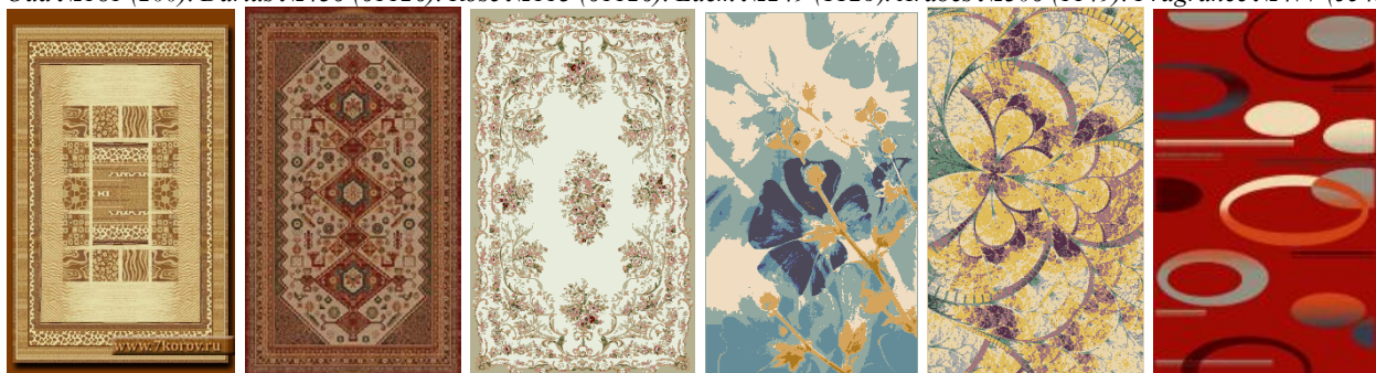
Safari №13 (1659). Ararat №435 (60210). European №516 (526). Pansy №548 (3432). Zlata №547 (1749). Disco №495 (63231).