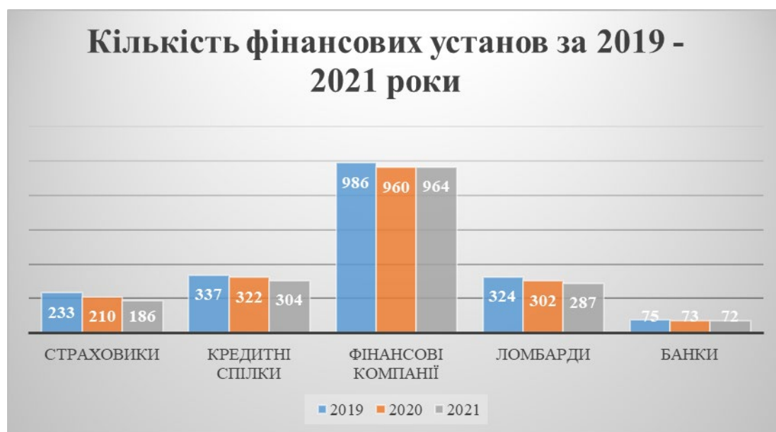
Рисунок 1 - Кількість фінансових установ за 2019 – 2021р.р.

Щоб зрозуміти функціонування внутрішнього фінансового ринку України, проаналізуємо кількість деяких фінансових установ (рис.1), а також капітал цих установ завдяки яким забезпечується функціонування фінансового ринку між учасниками цього ринку.