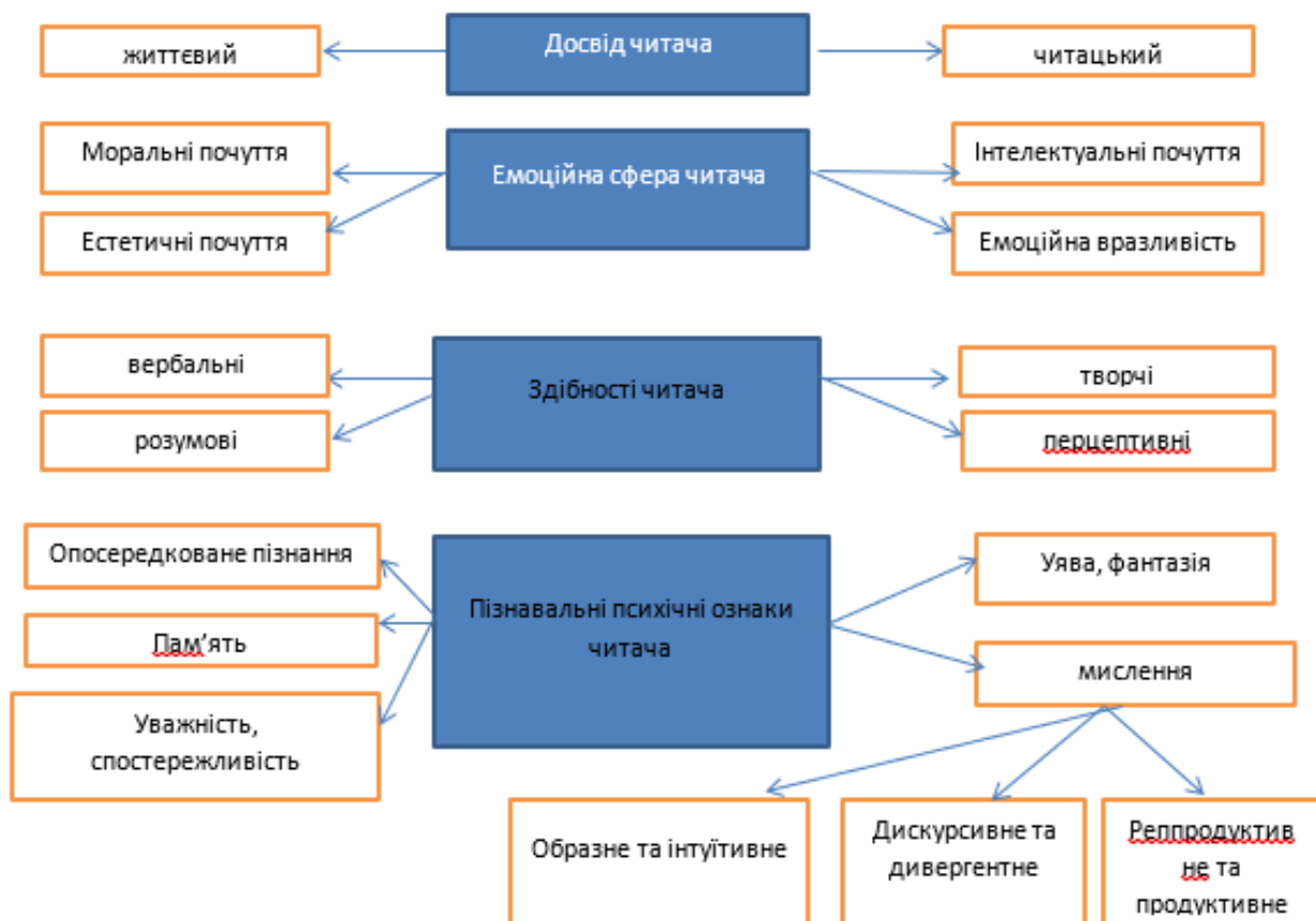
Рис. Структура художньо-образного мислення читача

Окремо зазначимо, що серед основних перцептивних здібностей читача, які впливають на розвиток художньо-образного мислення виокремлюємо такі: