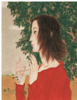
Мал. 1. Вей Хун-янь «Пін»

Це виявляється в лініях, композиції й використанні пігментів і кольорів сучасного живопису «чжунцай» (мал. 1).