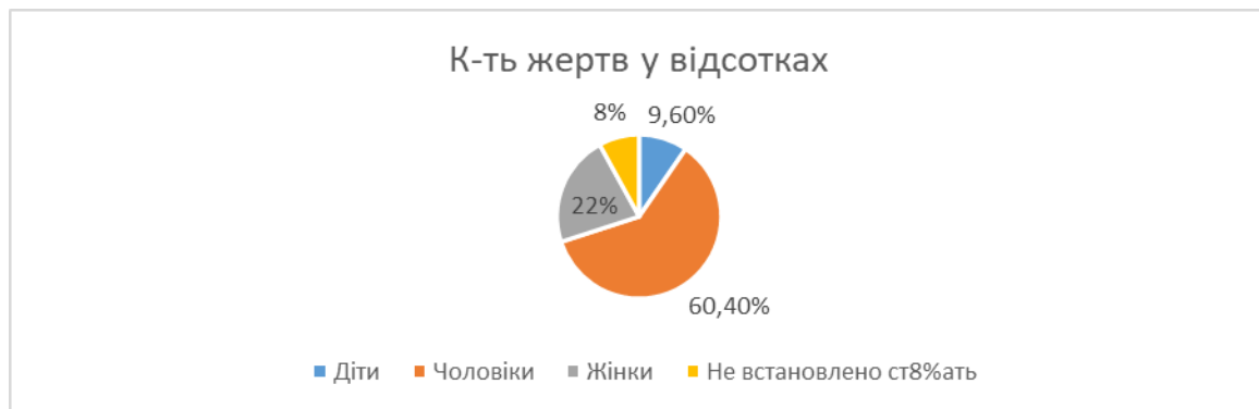
Рис. 2. Якісний склад (за статтю) 3078 жертв червоного терору (відсоток дітей, жінок, чоловіків, невстановлених решток тіл, виявлених у місцях меморіальних поховань) [3].