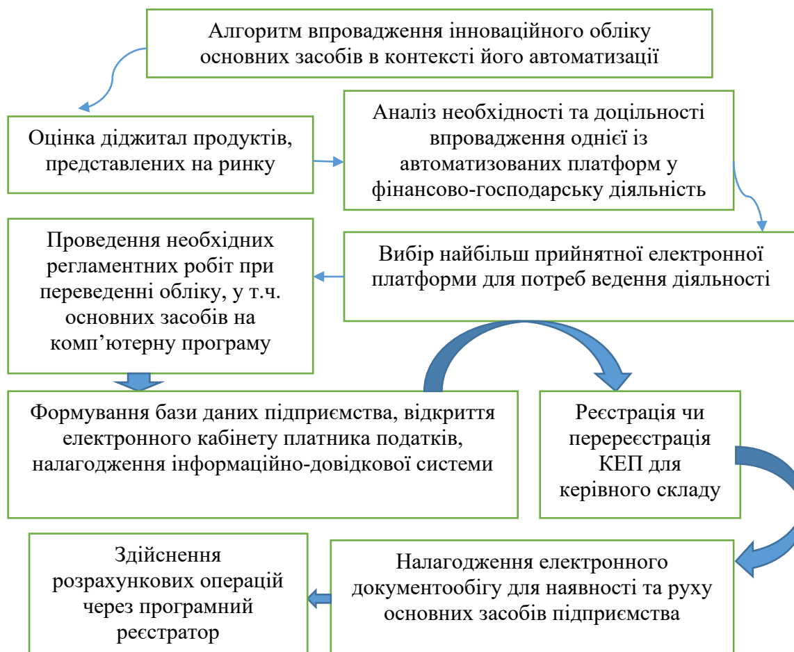
Рисунок 1. Алгоритм впровадження інноваційного обліку основних засобів в контексті його автоматизації

основних позиціях, як аналіз пропозиції на ринку автоматизованих продуктів, підбір оптимальної, а також безпосередній перехід ведення діяльності на нову діджитал платформу.