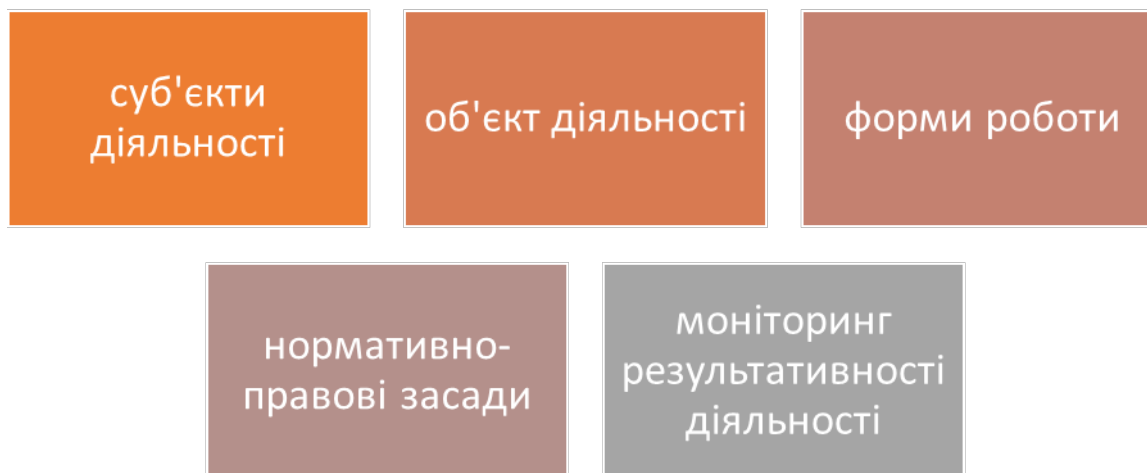
Табл. 1.1. Система діяльності колективу ЗЗСО щодо збереження ментального здоров'я учасників освітнього процесу

Як бачимо, в закладах освіти, зокрема повної загальної середньої освіти, особлива увага звертається на формування в учасників освітнього процесу таких рис як резильєнтність та майндфулнес. Для цього розроблена обґрунтована система щодо збереження ментального здоров'я учасників освітнього процесу.