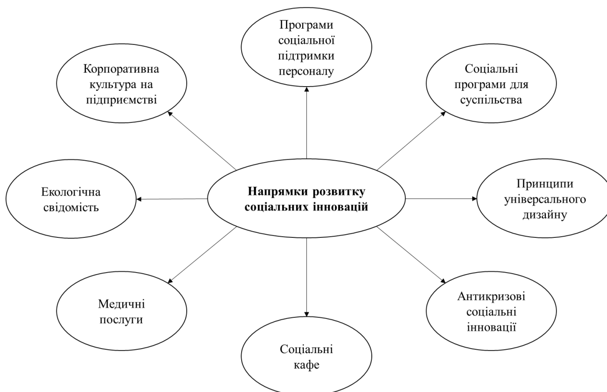
Рисунок 2 – Основні напрямки тенденцій соціальних інновацій у сфері готельно-ресторанного бізнесу

Визначено основні напрямки удосконалення соціальної діяльності готельно-ресторанного підприємства шляхом втілення інновацій (рисунок 2).