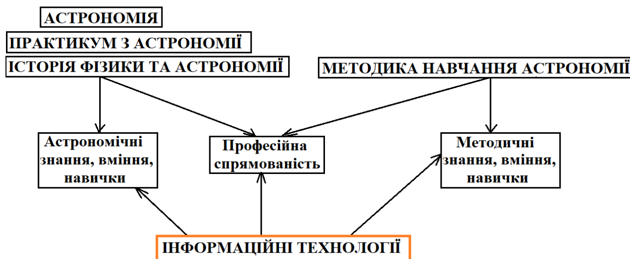
Рисунок 1 - Схема курсів для підготовки вчителя астрономії

Грунтуючись на напрямках вдосконалення професійної підготовки вчителя фізики та астрономії та принципі відбору змісту, структуру курсів «Астрономія», «Практикум з астрономії», «Історія фізики та астрономії» та «Методика навчання астрономії» можна представити у вигляді схеми (рисунок 1).