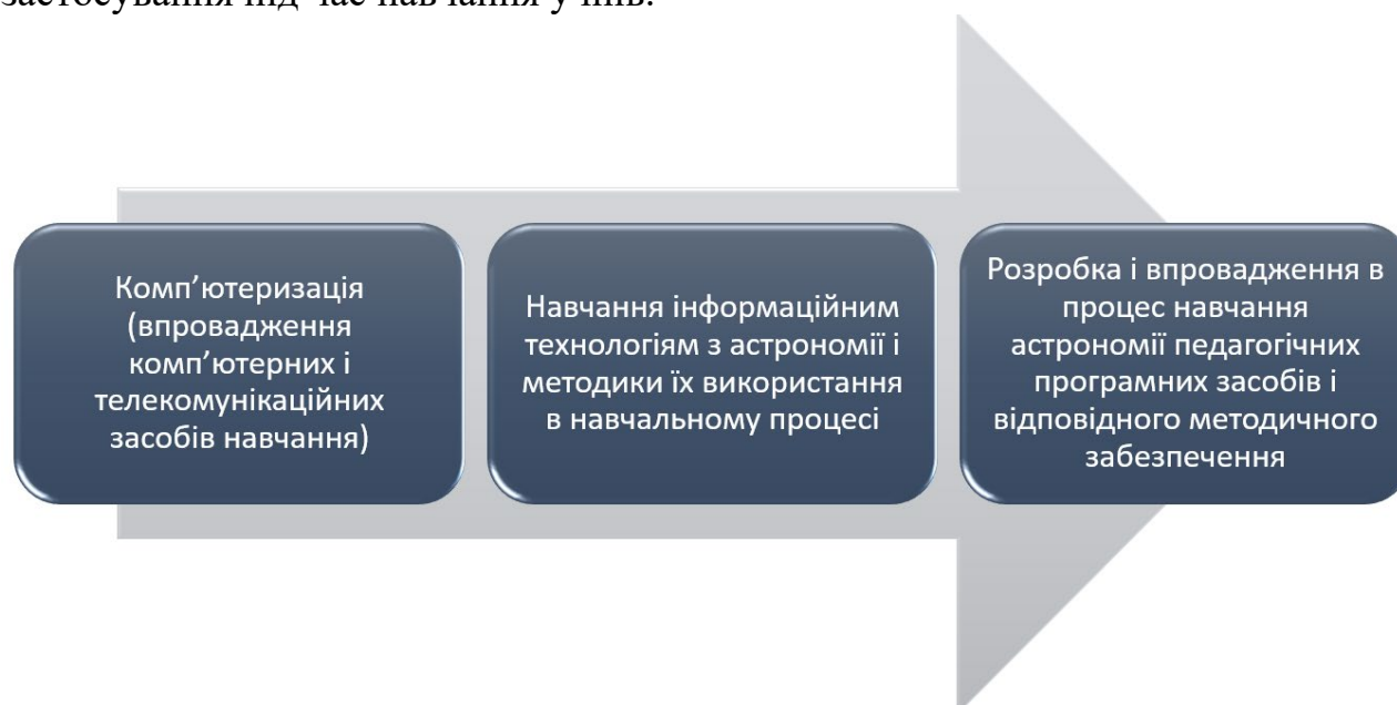
Рисунок 3 - Основні етапи інформатизації курсу астрономії

Удосконалення курсу астрономії на основі використання інформаційних технологій підкреслило потребу у формулюванні завдань інформатизації курсу астрономії в педагогічних закладах вищої освіти, а саме: активізація пізнавальної та професійної діяльності здобувачів вищої освіти за допомогою впровадження засобів інформаційних технологій; навчання студентів використанню інформаційних технологій у сфері астрономії та їх практичне застосування під час навчання учнів.