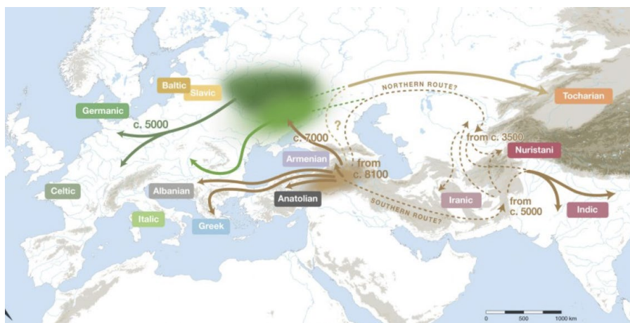
Рис. 2. Мовна сім'я почала розходитися приблизно 8 100 років тому з території, що розташована на південь від Кавказу [7]

Вже понад півроку світова преса активно пропагує рис. 2, називаючи його «омріяним вирішенням мовної загадки» на основі пропозиції «гібридної моделі», яка передбачає існування «колисок» у Вірменії та в степах України.