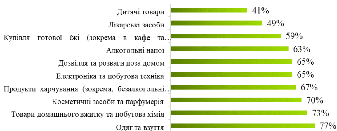
Рисунок 1 – Категорії товарів на яких заощаджували українці в 2023 році

Дослідження споживчих настроїв українців, проведене у 2023 році, показало стійку тенденцію до економії та обережного підходу до витрат. Хоча більшість українців залишається активними у споживчому секторі, вони стежать за своїми витратами та здійснюють покупки обдуманно. Виявлено, що українські споживачі продовжують активно економити та ретельно обдумувати свої витрати. Від 41% до 77% опитаних виявили схильність до економії, що свідчить про стійкий тренд у збереженні коштів. Харчові звички українців також переосмислюються, збільшилася кількість осіб, які купують продукти харчування на запас. У той же час, відвідування ресторанів та барів зменшилося, а приготування їжі вдома стало більш популярним [3].