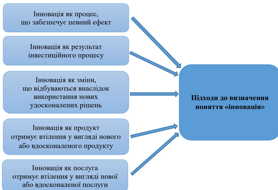
Рисунок 1 – Підходи до визначення поняття «інновація» в українській і зарубіжній теорії та практиці

Підсумовуючи вище викладене, а також залежно від об'єкта і предмета дослідження слід виокремити деякі підходи до визначення поняття «інновація» (рис. 1).